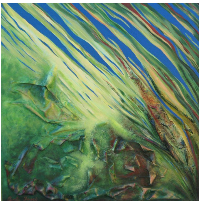
“Affiorare di un ricordo”, 2012 tecnica mista, 60x60